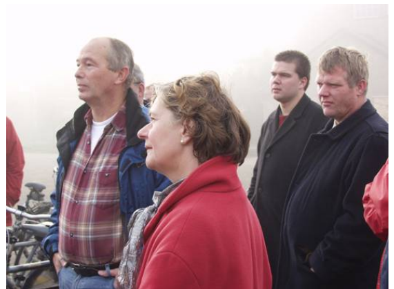
Raadsleden krijgen uitleg over de kazerneterreinen

De raad heeft zelf twee werkconferenties gehouden over het Masterplan. Bovendien zijn raadsleden op excursie geweest naar het Limos-terrein in Nijmegen (een project dat enigszins vergelijkbaar is met dit project) en hebben zij een fietstocht gemaakt over de kazerneterreinen en het Enka-terrein.