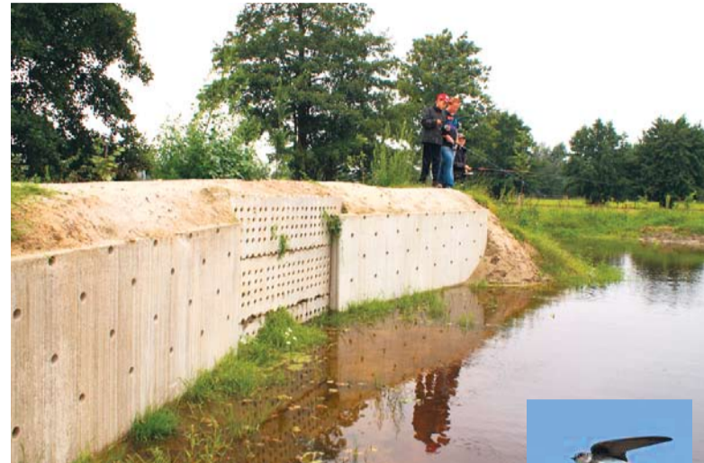
In de wand hebben afgelopen voorjaar en zomer diverse paartjes oeverzwaluwen gebroed.

De vrijwilligers van de IVN-Vogelwerkgroep Ede houden zich bezig met behoud en waar mogelijk herstel van de leefomgeving van vogelsoorten. Daarom organiseert de werkgroep voorlichtingsavonden en excursies. Ook voert de Vogelwerkgroep in en buiten de bebouwde kom inventarisaties en tellingen uit. De meest bekende tellingen zijn die van broedvogels, trekvogels en van wintergasten, zoals ganzen, zwanen en eenden. Nieuw