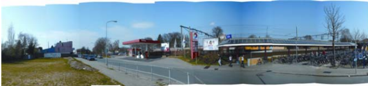
Foto-onderschrift: zicht op het huidige station vanaf het Zuidplein

Het poortgebouw en de vorm van het Enkacomplex blijven bewaard. Daardoor krijgt dit hele gebied een wat omsloten karakter: je krijgt van buitenaf niet direct een indruk van wat er binnen te vinden is. Dat maakt het tot een spannend woongebied. Binnen de grenzen van het voormalige fabriekscomplex is ruimte voor aparte woongebiedjes. Naast woningen is op het Enkaterrein ook ruimte voor andere gebouwen.